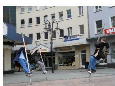
Gräser, Fa. Conlastic