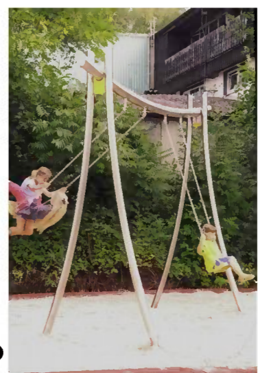
Kabana, mit Fallschutz Fa. Conlastic