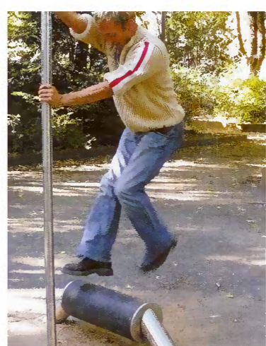
Rolle, Fa. Conlastic