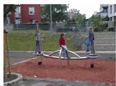
Gondel, mit Fallschutz Fa. Conlastic