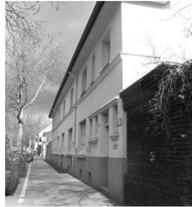
Fünf und zweigeschossige Bebauung an der Leyendeckerstraße

Zur Christianstraße hin fällt das Gelände um zwei Meter ab.