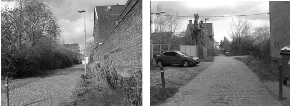
Fußwegeverbindung zwischen Leyendeckerstraße und Christianstraße

In Ostwestrichtung verläuft eine Fußwegeverbindung durch das Plangebiet. Diese führt von der Leyendeckerstraße durch den Leo-Amann-Park in das Bezirkszentrum Ehrenfeld und zum Bezirksrathaus.