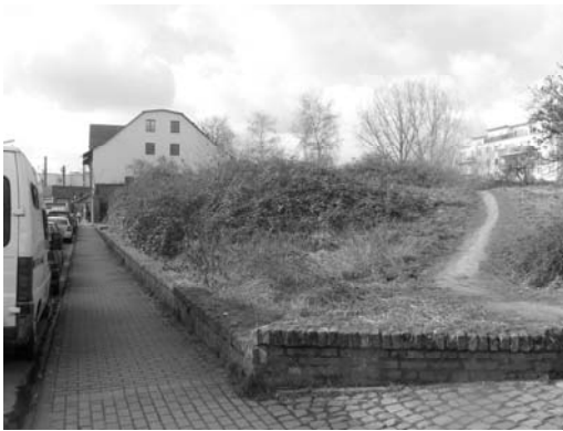
Geländesprung an der Christianstraße

Zur Christianstraße hin fällt das Gelände um zwei Meter ab.