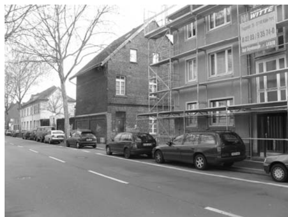
Vorhandene Gebäude an der Leyendeckerstraße