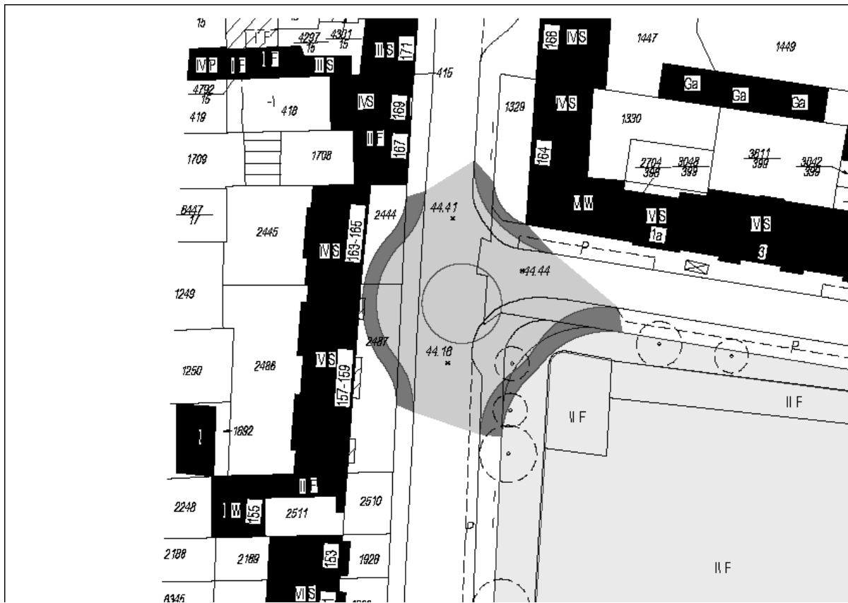
Prinzipskizze eines Kreisverkehrs an der Niehler Straße/Xantener Straße (Durchmesser = 30 m + 2,50 m Fußweg) Flächeninanspruchnahme