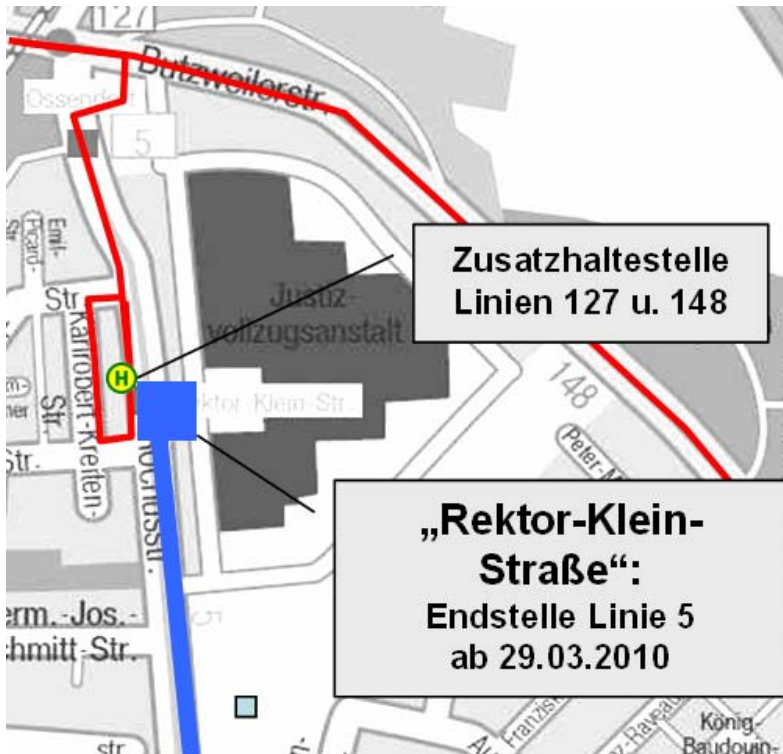
Abbildung 2: Busführung zwischen 29. März und den Sommerferien 2010