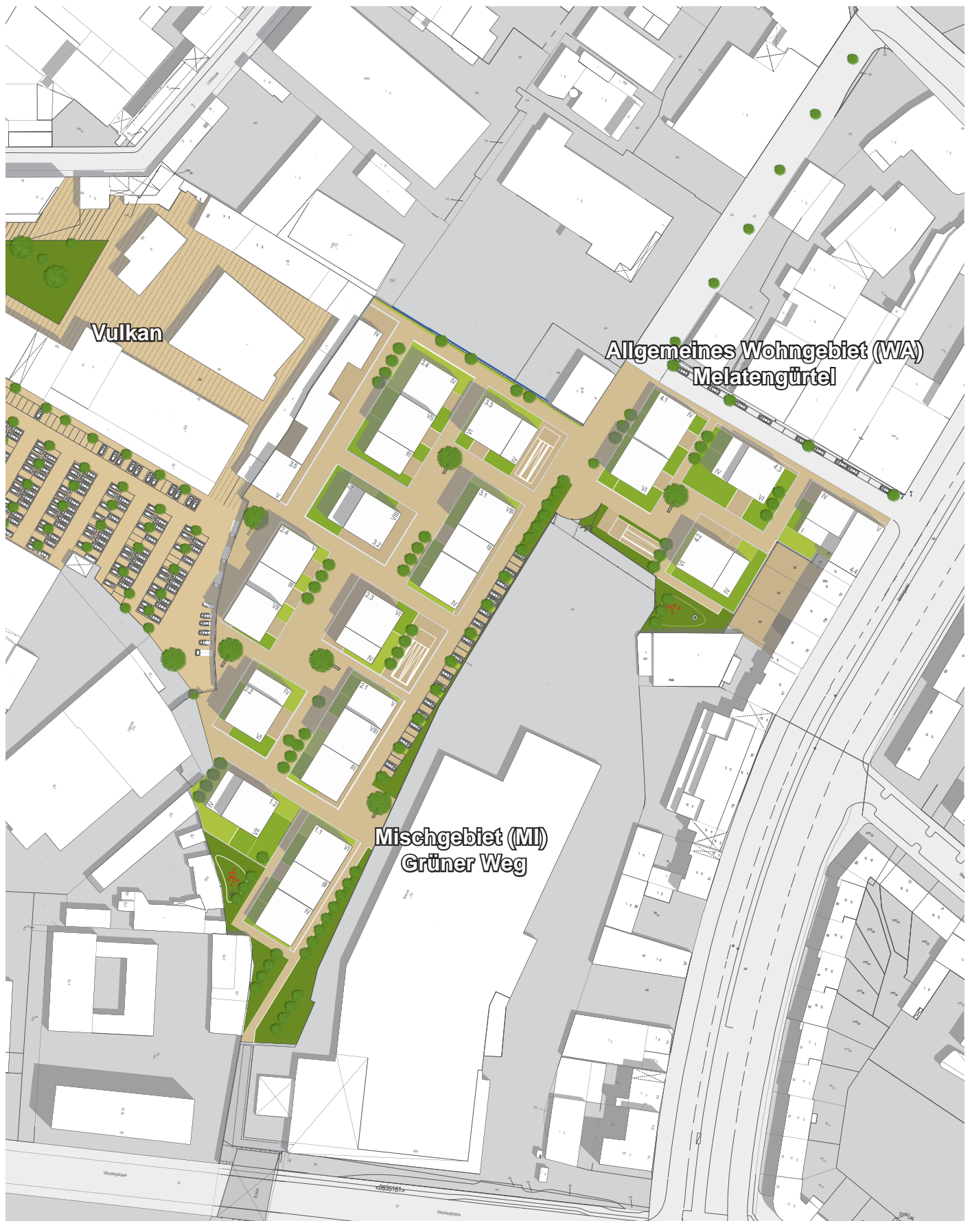
Lageplan zum Entwicklungskonzept Grüner Weg: M:1:2.000