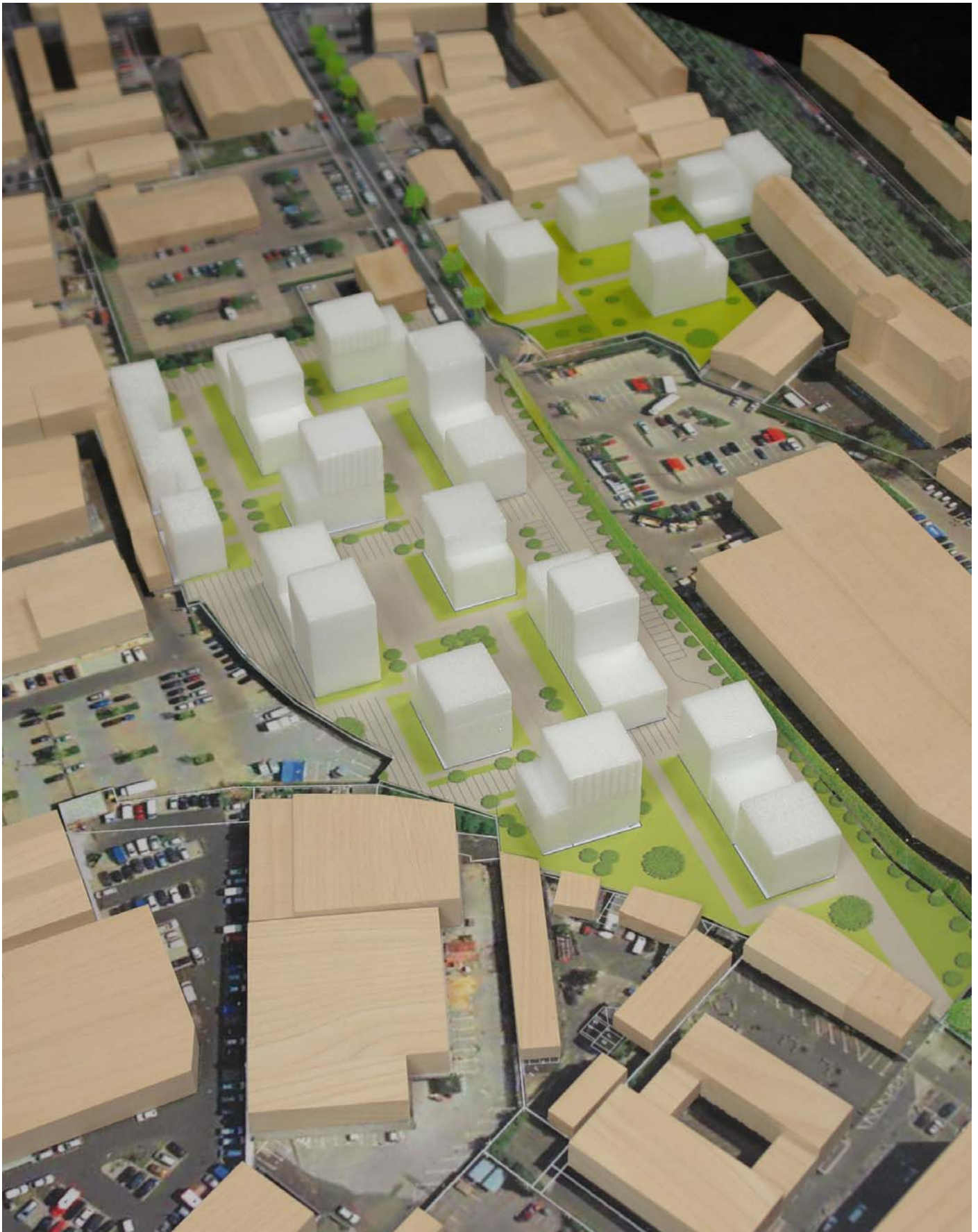
Modellfoto Gesamtübersicht Entwicklungskonzept Grüner Weg