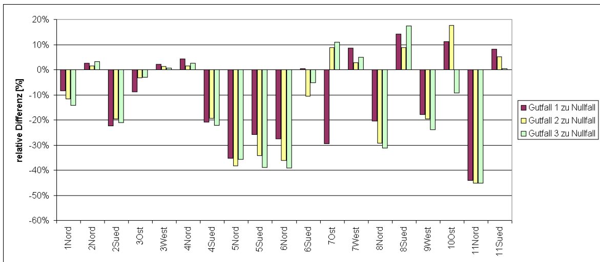
Abb. 2: Vergleich der relativen Differenzen der NOx-Emissionen der Gutfälle zum Nullfall für die betrachteten Straßenabschnitte (unterschieden nach Fahrtrichtung).