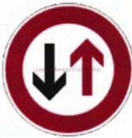
Dem Gegenverkehr Vorrang gewähren (Verkehrsschild Nr. 208)