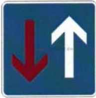
Vorrang vor dem Gegenverkehr (Verkehrsschild Nr. 308)