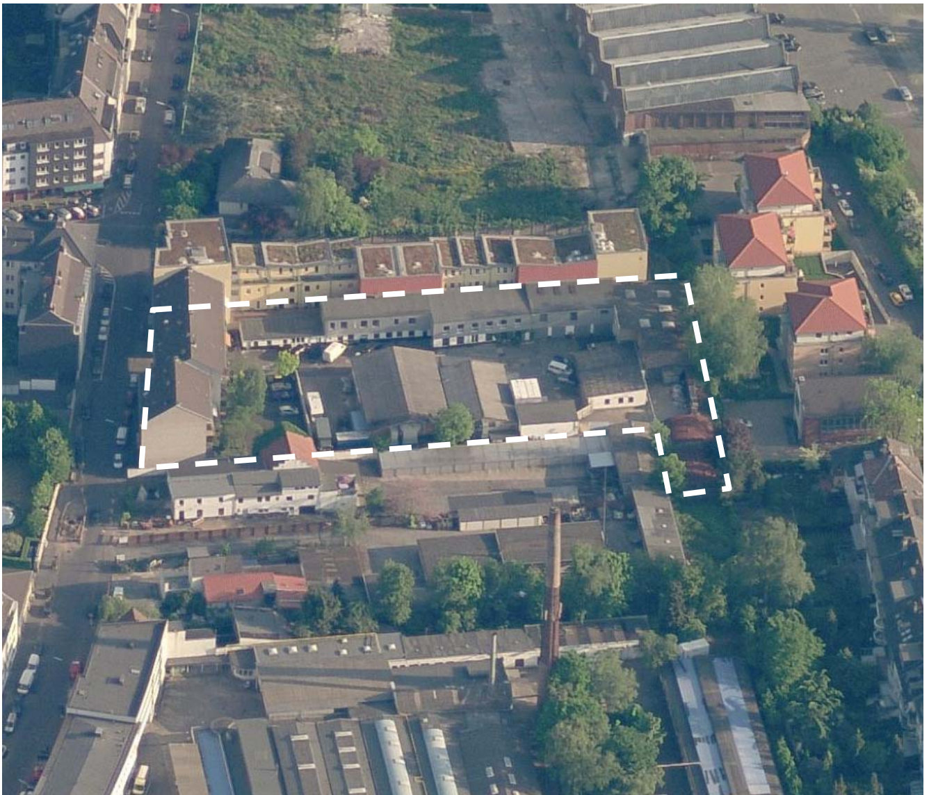
Schrägluftbild ohne Maßstab