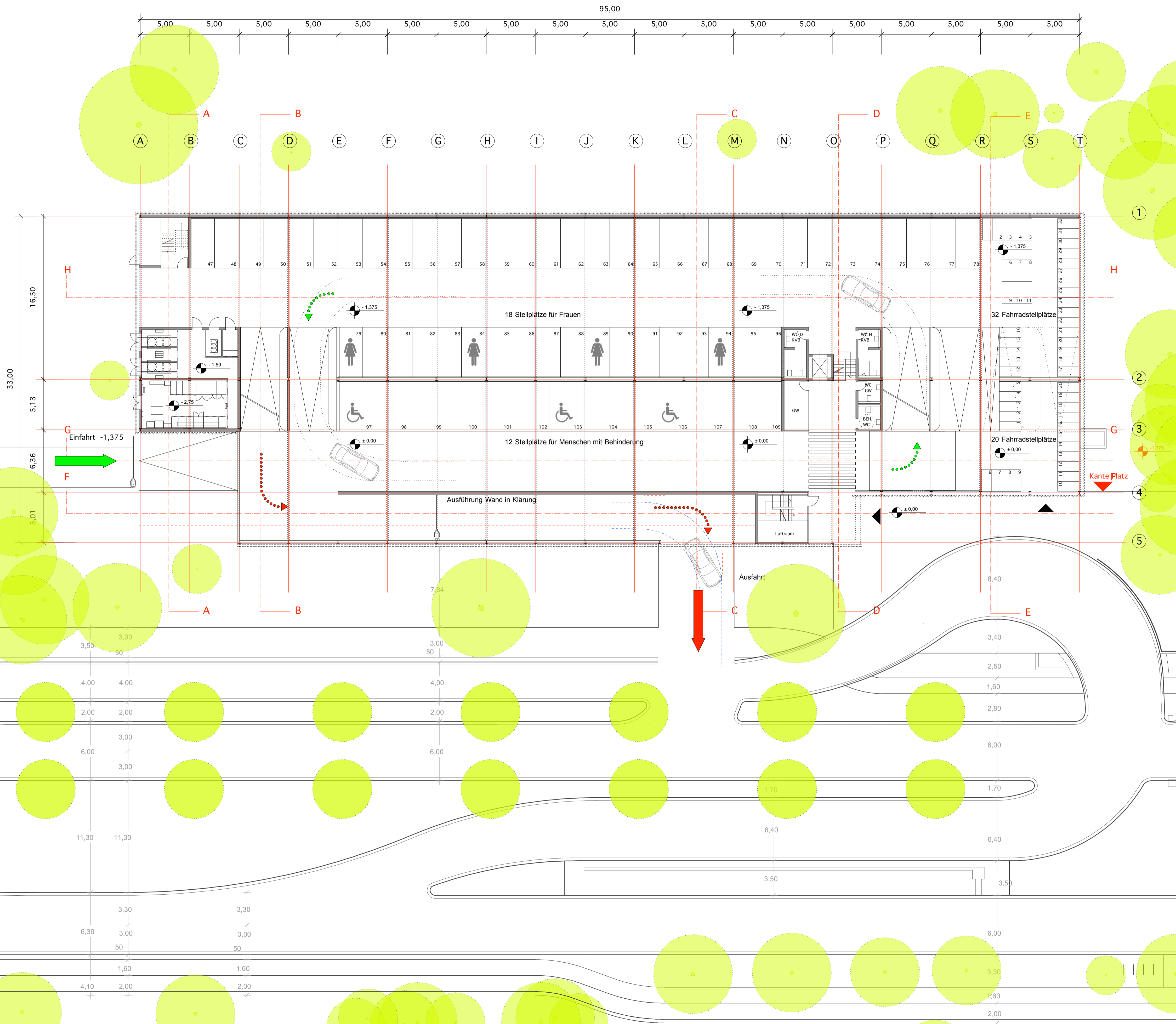
Grundriss Erdgeschoss M 1:200