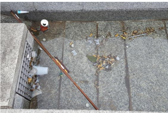
Zigarettenkippen und Unrat in den Wasserbecken

unlängst konnte man in den Kölner Medien lesen, dass die Brunnensaison 2017 wieder eröffnet ist. Brunnen sind Teil der städtischen Identität und beliebte Ausflugsziele. Zudem prägen sie das Stadtbild und schaffen eine positive Atmosphäre.