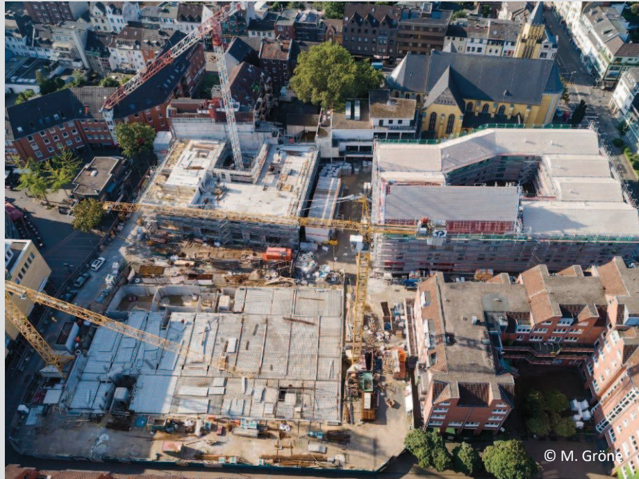
Luftbild Stand Anfang September 2021