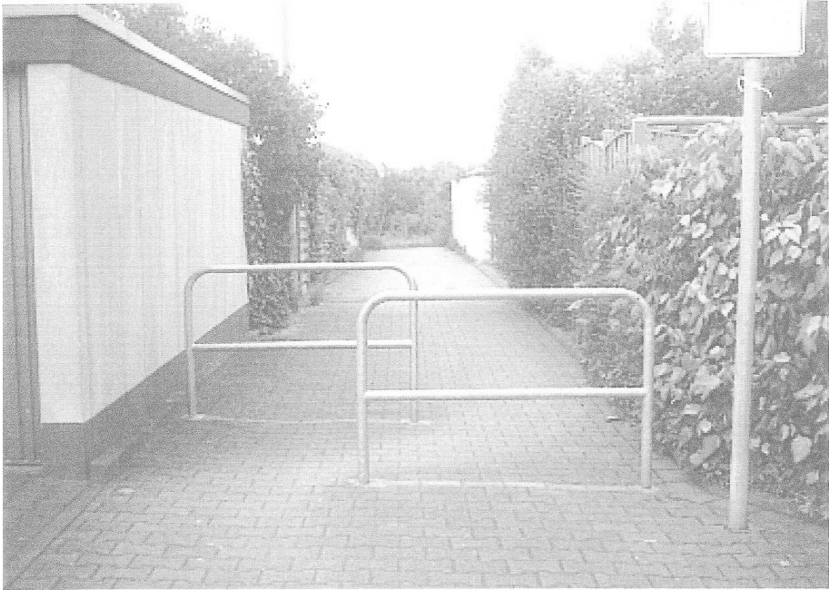
Ist-Situation – Drängelgitter auf der Gemeindestraße vor dem Grundstück Fröbelstr.107 Herausnehmbarer Poller am Ende der Gemeindestraße, an der Grenze zur öffentlichen Grünfläche