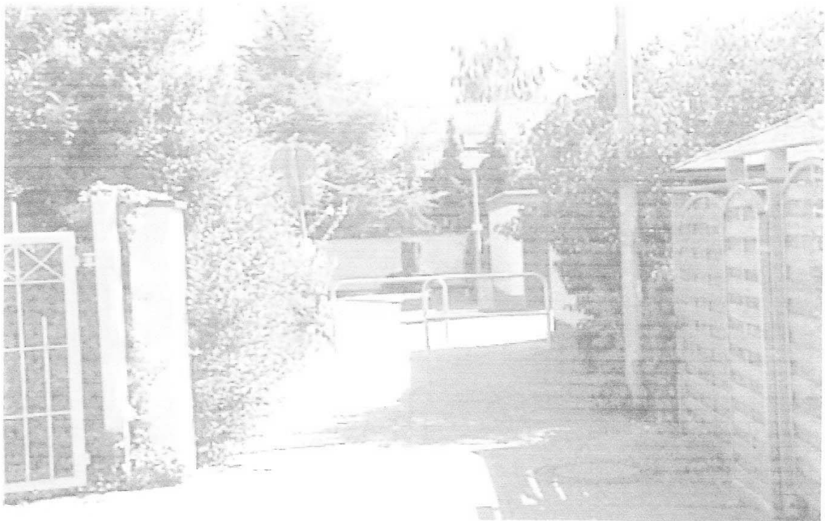
Ist-Situation – Drängelgitter auf der Gemeindestraße vor dem Tor Fröbelstr. 107