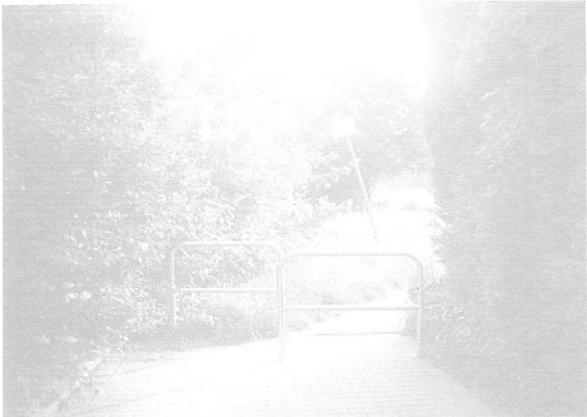
Ist-Situation – 4 Häuser weiter – ebenfalls Gemeindestraße, Fröbelstr. 47b Drängelgitter an der Grenze zur öffentlichen Grünfläche Schild Winterdiensthinweis für die Grünfläche auf der Grünfläche